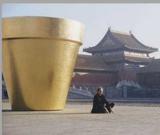
Pot Doré (Pékin)

Jean-Pierre RAYNAUD : plasticien français né en 1939.